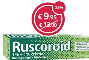
RUSCOROID 1%+1% Crema ret.40g trattamento dei sintomi associati ad emorroidi