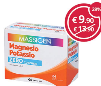
MASSIGEN Magnesio Potas. zero z. 24 bst Per combattere stanchezza e spossatezza