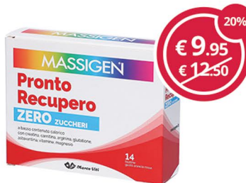
MASSIGEN Pronto recupero zero zucc. 14 bst. Per combattere stanchezza e spossatezza