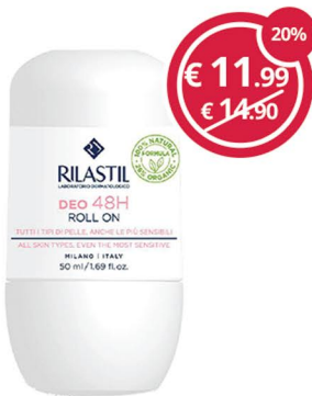
RILASTIL Deo roll on 48h 50ml azione antitraspirante di lunga durata