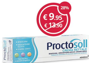
PROCTOSOLL crema rettale 30g trattamento sintomatico di emorroidi esterne