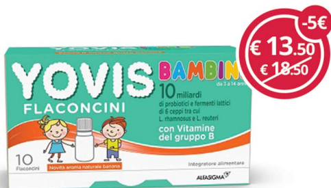
YOVIS Bambini Banana 10 flc. per l'equilibrio della flora intestinale