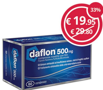
DAFLON 60 compresse riv 500mg Per il trattamento dei sintomi di insuf. venosa e fragilità capillare