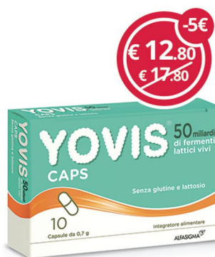
YOVIS 10 capsule per l'equilibrio della flora intestinale