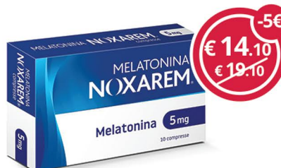
NOXAREM 10 capsule 5mg. per il riposo notturno