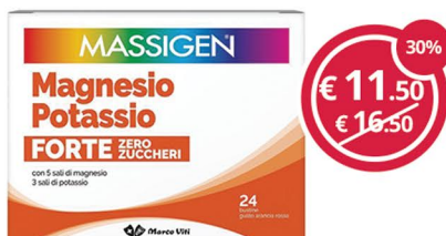
MASSIGEN Magnesio potassio forte zero zuccheri 24 bustine per combattere stanchezza e spossatezza