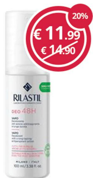
RILASTIL Deo vapo 48h 100ml azione antitraspirante di lunga durata