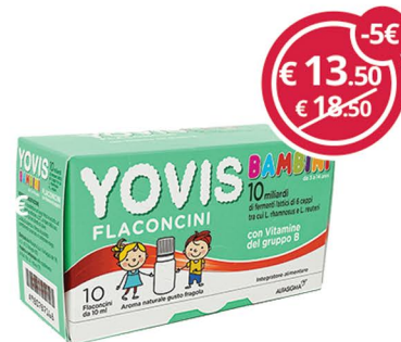
YOVIS Bambini fragola 10 flc per l'equilibrio della flora intestinale